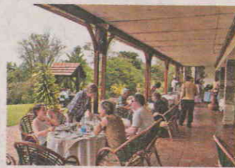
住客可在附近的 Outdoor 酒店，食午餐後才入公園。

a. Treetops 地址：Aberdare National Park, Kenya 房價：雙人房由 $1,764 起，包 3 餐及野外 Safari Game Drive 網址：www.aberdaresafarihotels.com/