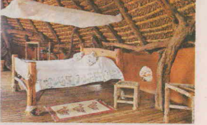
酒店的一樑一木，都是就地取材，由當地工匠建造。