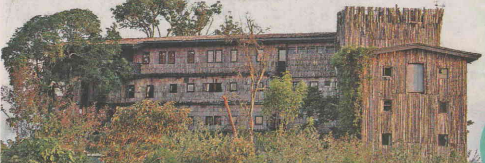
以全木建築的 Treetops 很有特色，個人感覺還有點像仙境般寧靜的世界。