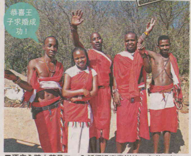
恭喜王子求婚成功！