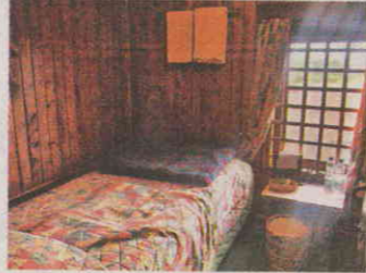
房間佈置舒服簡樸。