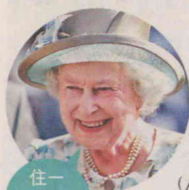
住一晚就變女王喇！ (設計對白)