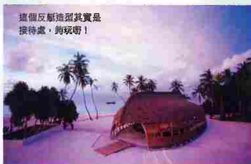
這個反艇造型其實是接待處，夠玩嘍!

開業剛足半年的馬爾代夫Alila Villa Hadahaa最近推出勁價優惠，之前入住4晚連機票和住宿起碼要萬八蚊，現在6日4夜的套票卻萬四蚊有找。如在3月訂購，《新假期》讀者更有尊享的優惠，現在6日4夜的套票每位只需$13,720之餘，更包多一次外島浮潛及Garden Spa水療服務(若非《新假期》讀者，以上活動只能二揀一)。我們Check過，這兩個項目的收費要每項$1,500，現在以2人計算，即係慳番$3,000，計埋平啱近$7,000的套票價錢，總共平$10,000!