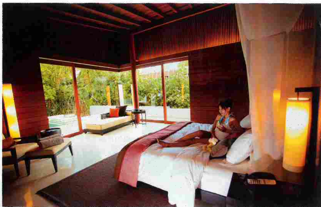
在Alila Villa Hadahaa可望出去綠意盎然，私隱度又夠高。