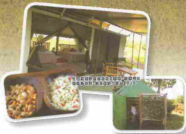
生態旅遊的食宿豪華又舒適，設備均以環保為準則，如自釀的小波屋(下)。